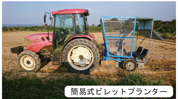
簡易式ビレットプランター

さとうきびを全茎のまま刈り倒す機械です。多くの作業が機械化されている中で種苗の準備だけが手作業のまま残っているため、この作業の機械化に現在、各メーカーが開発に向け模索しているところです。