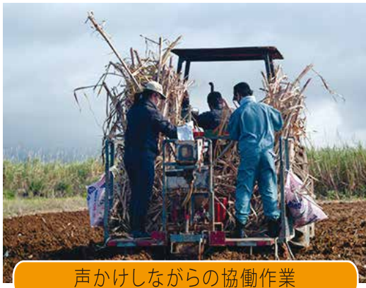
声かけしながらの協働作業