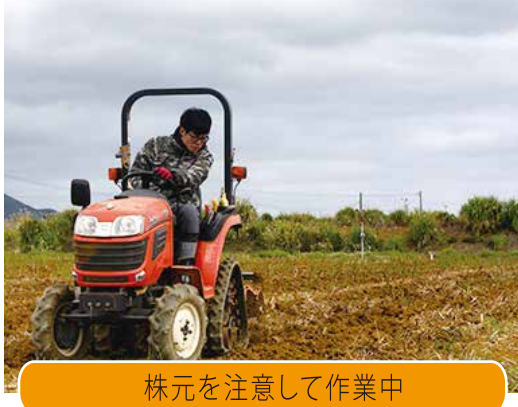
株元を注意して作業中