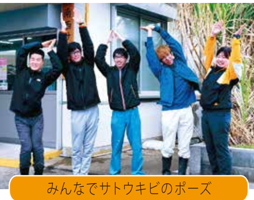
みんなでサトウキビのポーズ