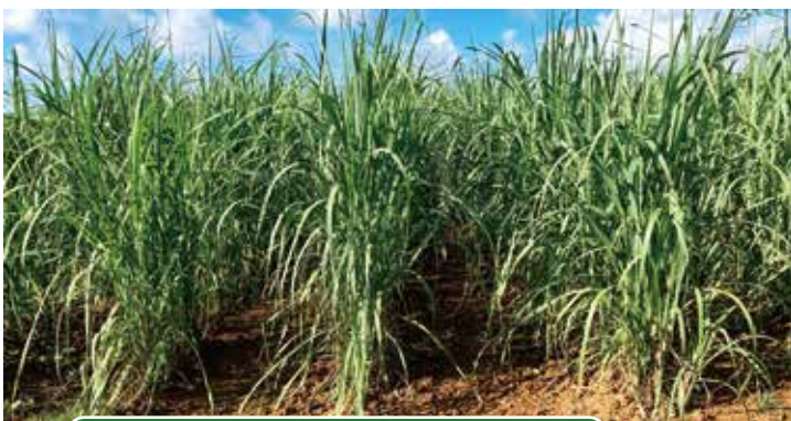
スクープで管理作業した圃場