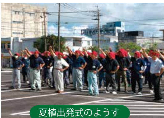
夏植出発式の様子

また、町糖業部会の担 当者から夏植支援助成に 対する説明があり、目標 達成を呼びかけました。 なお、夏植え等のご相 談は、各原料事務所まで お問い合わせください。