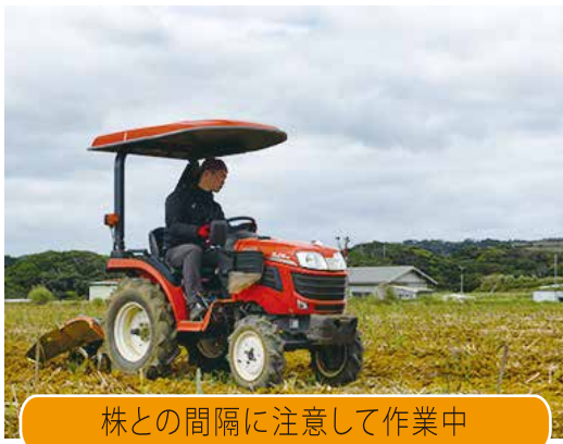
株との間隔に注意して作業中